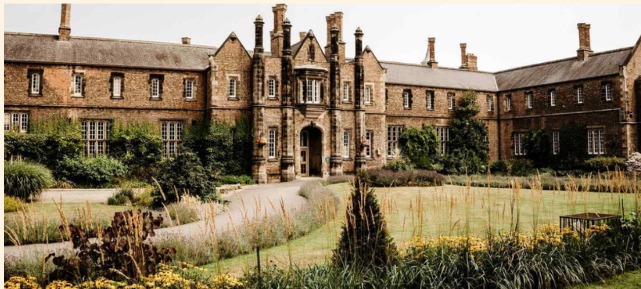
Το Πανεπιστήμιο York St John